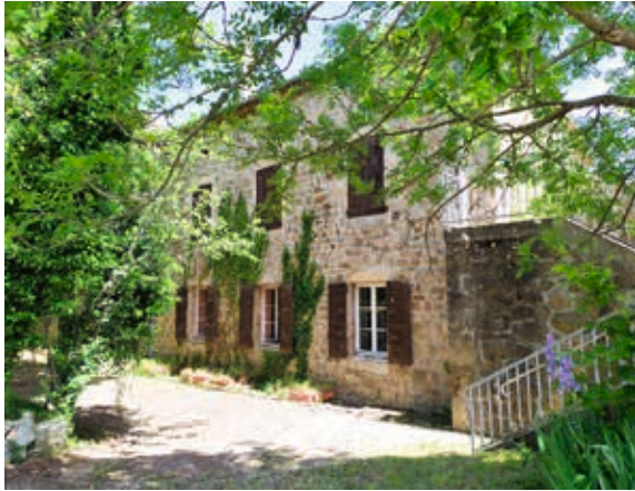
Maison de Clavières