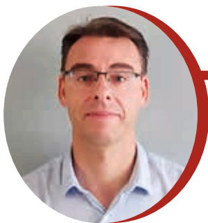
Yann Eyssautier Maire de Saint-Félicien