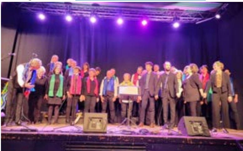
Concert 2023 :

Renseignements : acorpsparchoeur07@gmail.com