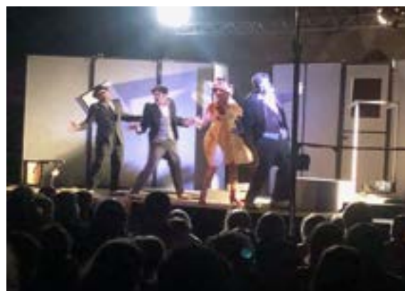
Le 9 août: soirée théâtre avec la Compagnie des Passeurs